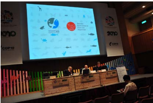
(全景) 100名超の大きな会場