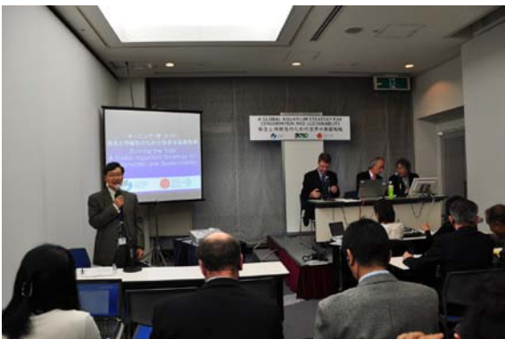
1.ペニング会長が世界水族館戦略を発表