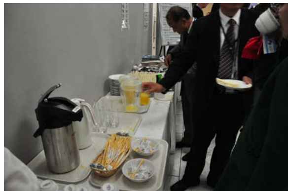
ケータリング(事前に軽食を主催者側で用意)