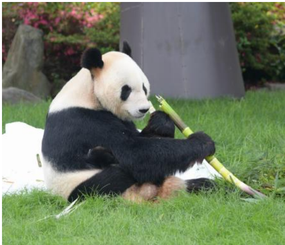
ジャイアントパンダ「永明」

「良浜」は2000年に日本国内では12年ぶりの赤ちゃんパンダとして誕生しました。立派に成長した後、2008年にはふたごの「永浜（えいひん）」「梅浜（めいひん）」を出産しました。これは日本で生まれたジャイアントパンダが出産した初めての例となり、これまで6回の出産で9頭の赤ちゃんを産み育ててきた、ベテランのお母さんパンダです。