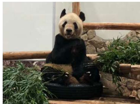
「永明」が愛用したタイヤも展示します！

■内容：①成都ジャイアントパンダ繁育研究基地から届いた最新映像の放映 ②特大「永明」フラッグ設置 ③パンダ飼育の思い出アイテム展示