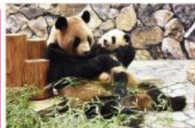
新たな出会いと感動の空間 パンダファミリーに感動の大接近