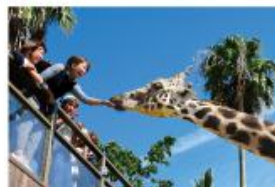
野生を感じる、自然からの 熱いメッセージに目を傾ける、ひととき