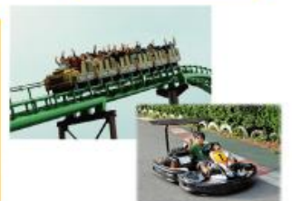
型にこだわらない遊びがまっている