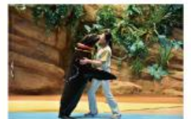
遠い昔から一緒だった 海からのやさしい贈り物に出会う