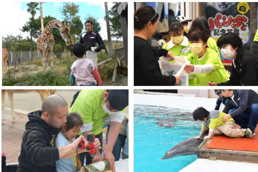
2023年11月23日開催の様子

「ドリムデー・アット・ザ・ズー（主催：和歌山ドリムデー2024実行委員会）」を2024年11月6日（水）アドベンチャーワールド（和歌山県白浜町）で開催いたします。アドベンチャーワールドで、どのような特性や属性の方も気兼ねなく、自由にお楽しみいただけるときをお過ごしいただきたく、以下の通り開催のご案内を申し上げます。