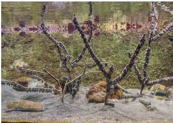
＜鈴なりになった産卵用の枝＞