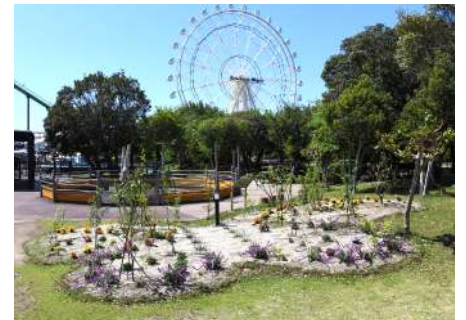
チョウのファミリーレストラン

夏に向けて、虫たちの活動が活発になり、これまで以上に生命の営みが観察しやすくなります。 チョウの卵から生まれた幼虫が脱皮をくり返して大きくなり、サナギ、そして成虫へと育っていく姿をゲストの皆様と一緒に見守る場所となることを願っています。