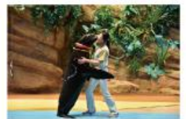
遠い昔から一緒だった 海からのやさしい贈り物に出会う