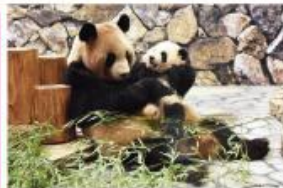
新たな出会いと感動の空間 パンダファミリーに感動の大接近