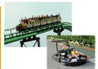
型にこだわらない遊びがまっている