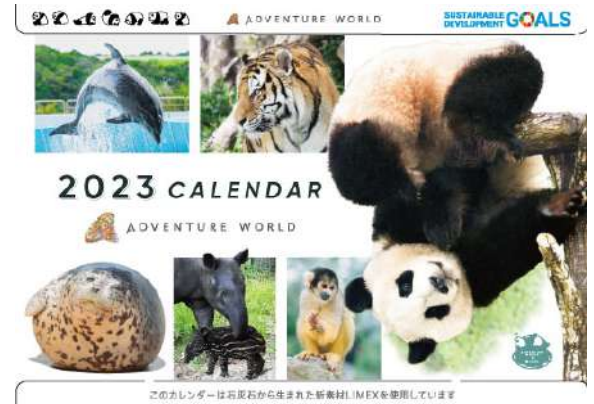
このカレンダーは石灰石から生まれた新素材LIMEXを使用しています