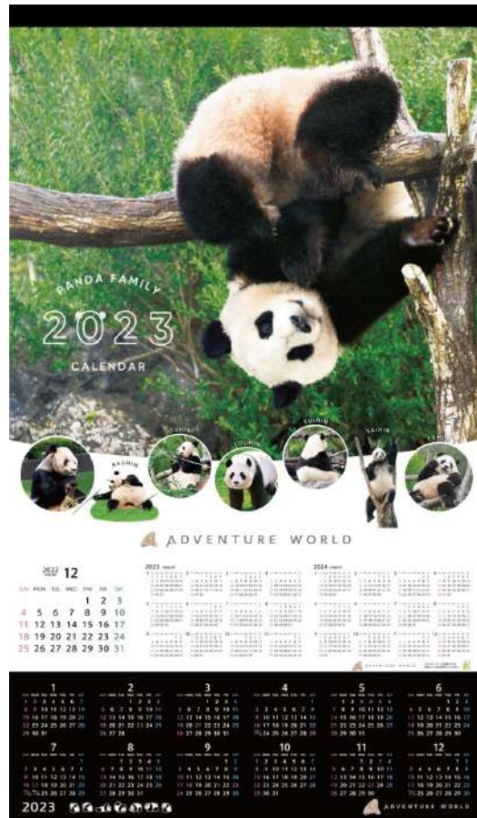
パンダファミリー (A2サイズ)

アドベンチャーワールド（和歌山県白浜町）は2023年版のオリジナルカレンダーを2022年12月1日（木）よりA2サイズのオールキャスト・パンダファミリーの2種類、卓上カレンダー1種類の合計3種類を販売いたします。パークフォトグラファーが撮影し厳選した写真から構成されたカレンダーには、動物たちの未来に生きようとする姿、そして命が繋がっていく奇跡が綴られています。