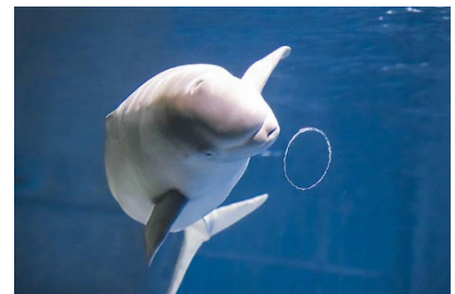
バブルリングで遊ぶ「ヴィズ」