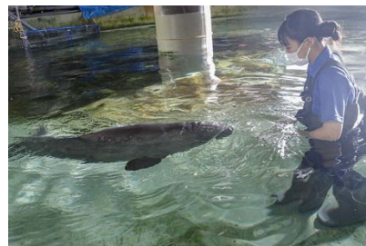
飼育員とのリハビリの様子