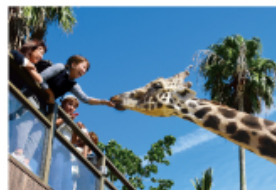
野生を感じる、自然からの 熱いメッセージに耳を傾ける、ひととき