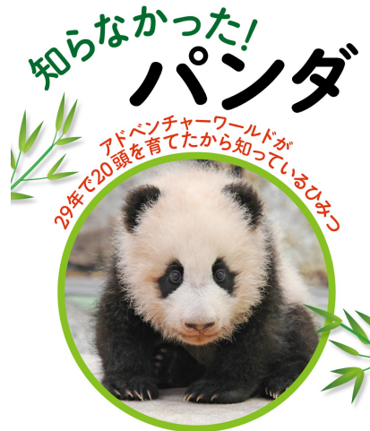
アドベンチャーワールド「パンダチーム」