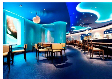
レストラン「オーシャン」