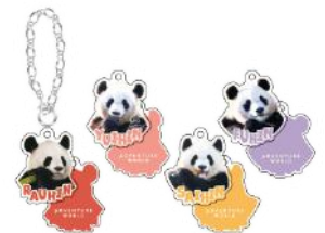
▲アクリルチャーム イメージ