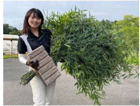
竹(孟宗竹)の産卵床