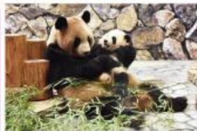
新たな出会いと感動の空間 パンダファミリーに感動の大接近