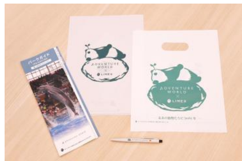
パーク内で導入しているLIMEX製品