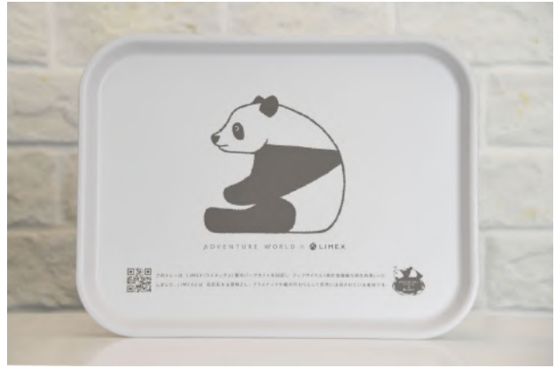
LIMEXシート製パークガイドを回収アップサイクルしたトレー

アドベンチャーワールド（和歌山県白浜町）は、SDGs宣言・パークポリシーにおいて、自然と資源が循環する廃棄物ゼロ（循環型）パークを目指しています。この度、廃棄物ゼロパークへのアクションとして、株式会社TBM（代表取締役CEO：山崎敦義）と協力し、石灰石を主原料としたLIMEX製の飲料カップを導入いたします。使用後は回収し、アップサイクル製品の第1弾として、パークで使用するトレーに生まれ変わる予定です。