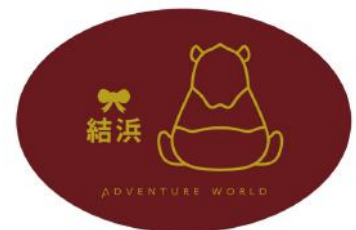
弁当箱：「結浜」デザイン（赤）