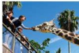
野生を感じる、自然からの 熱いメッセージに耳を傾ける、ひととき