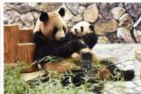
新たな出会いと感動の空間 パンダファミリーに感動の大接近