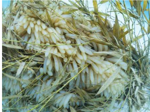
2022年産卵の様子（伊古木漁港区域）

アドベンチャーワールド（和歌山県白浜町）は、パンダバンブープロジェクト活動の一環として、和歌山南漁業協同組合協力のもと、白浜町と共同で、地元和歌山・白浜の自然豊かな海の継承を目的に、ジャイアントパンダが食べ残した竹の枝葉を有効活用したアオリイカの産卵床を製作し、白浜の海底へ設置いたします。