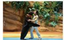
遠い昔から一緒だった 海からのやさしい贈り物に出会う