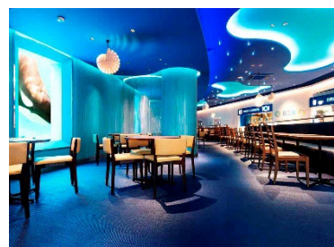
レストラン「オーシャン」

内容：①シャチへの給餌体験（体験時の写真を各々にプレゼント） ②シャチと記念写真（1グループにつき写真を1枚プレゼント） ③トロピカルアイランド裏方見学 （水族館機械室見学・アカウミガメ子ガメの観察など） ④シャチトレーナーによる「シャチものしり講座」受講 ⑤窓の向こうにシャチが泳ぐ！レストラン「オーシャン」での夕食 （2月25日(土)のみ、夕食会場をレストラン「サンクルーズ」に変更します） ⑥オリジナルグッズが当たる抽選会 ⑦「ナイトアドベンチャー」で夜の動物たちの寝姿を観察 ⑧参加当日は開館時間(9:00)より鴨川シーワールドへの入館が可能 ⑨車で来館する場合は第1駐車場を確保（駐車料金は有料） ※当プログラムは、荒天により中止となる場合がありますのでご了承ください