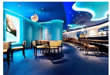
レストラン「オーシャン」

内容：①トロピカルアイランド裏方見学 (水族館機械室見学・アカウミガメ子ガメの観察など) ②ベルーガと記念写真(1グループにつき写真を1枚プレゼント) ③シャチナイトパフォーマンス ④窓の向こうにシャチが泳ぐ レストラン「オーシャン」での夕食 ⑤「ナイトアドベンチャー」で夜の動物たちの寝姿を観察 ⑥参加当日は開館時間(9:00)より鴨川シーワールドへの入館が可能 ⑦入館時にオリジナルポンチョプレゼント ⑧車で来館する場合は第1駐車場を確保(駐車料金は有料です) ※当プログラムは、台風等の荒天により中止となる場合がありますので ご了承ください