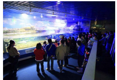
ナイトアドベンチャー