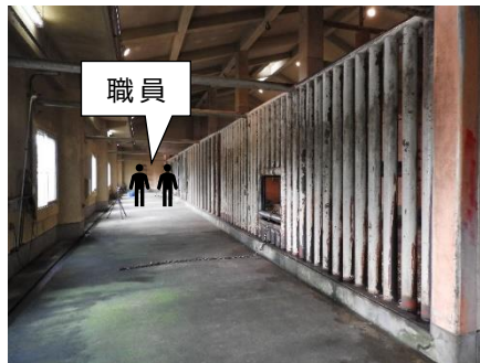
(図3)撮影可能区域から見た様子