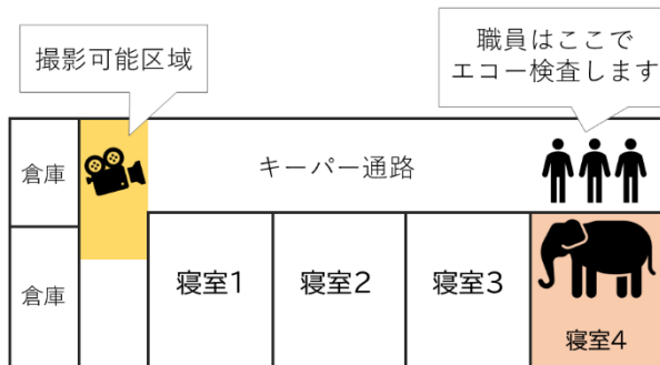
(図2)エコー検査時の撮影可能区域