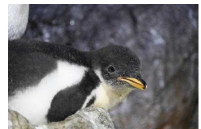
ジェンツーペンギンの雛