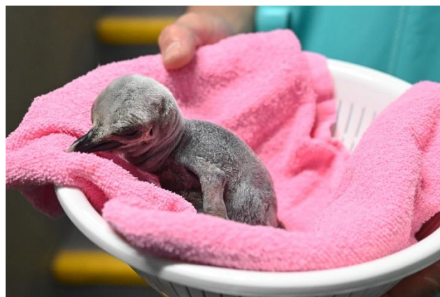
オウサマペンギンの雛（8月28日撮影）

現在雛は「南極大陸」水槽内で暮らしており、当面の住処となる親鳥の足元から時折顔を見せるほか、親から餌をもらうなどの子育ての様子も確認されており、すくすくと成長中です。