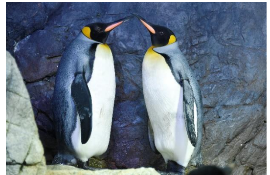
オウサマペンギン（成鳥）

南極大陸周辺地域に生息。ペンギン目内で2番目に大きなペンギンで、体長約90cm、体重約12kg程に成長する。海遊館では今回の雛を含め計45羽の雛が誕生しています。