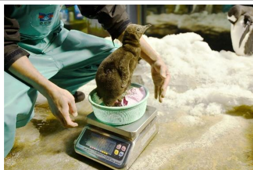
参考：過去の体重測定の様子