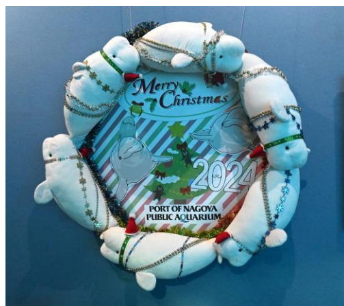
昨年の館内装飾の様子