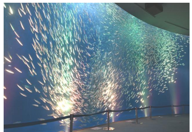
「マイワシのトルネード」クリスマスバージョン