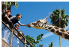
野生を感じる、自然からの 熱いメッセージに耳を傾ける、ひととき