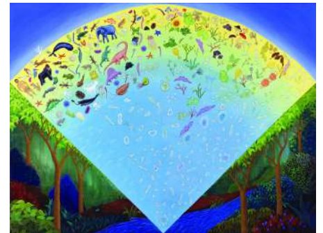
生命誌絵巻（JT生命誌研究館）

「生命誌」とは、人間も含めてのさまざまな生きものたちの「生きている」様子を見つめ、そこから「どう生きるか」を探す新しい知です。地球上の生きものたちは38億年前の海に存在した細胞を祖先とし、時間をかけて進化し多様化してきた仲間です。すべての生きものが細胞の中に、それぞれが38億年をどのように生きてきたかの歴史をしるすゲノムDNAを持っています。ゲノムDNAは、壮大な生命の歴史アーカイブです。その歴史物語を読み解き美しく表現することで、生きものの魅力を皆で分かち合い、生きることにについて考えていく場が「研究館」“Research Hall”です。