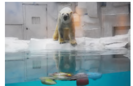
プレゼントイメージ