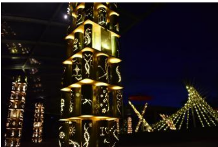
2019年8月設置 竹あかり

2019年8月より「つながるSmile竹あかり」としてジャイアントパンダが食べ残した竹幹を活用して竹あかりの制作及びパーク内への設置・点灯し、ゲストの皆様にご覧いただいています。ジャイアントパンダの食事を使う「竹」は、大阪府岸和田市の竹林から調達しています。岸和田市では、竹が生えすぎることによって里山に暮らす動物や植物にとって環境が悪化しているため、増えすぎた竹をパンダの食事用として切り出すことで、荒廃を防いでいます。しかしジャイアントパンダは、竹の葉の部分を食べるので、「竹幹」は残ります。この竹幹の活用方法の1つとして、「竹あかり」プロジェクトをスタートしました。現在、「竹幹」の将来的な活用方法として「竹堆肥」や「竹粉」、「工芸品」などの可能性を模索、「循環型パーク」の取組を進めています。