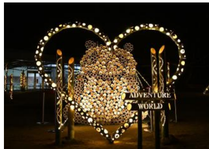
2019年12月設置 竹あかり