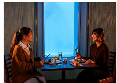
・レストランでのセミコースディナー