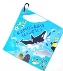
・オリジナル くつつタオル①