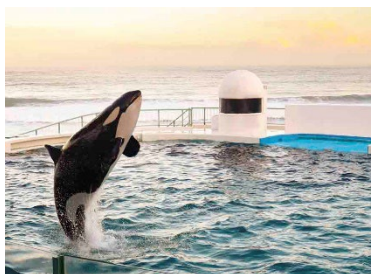
・『Special Night with Orca』