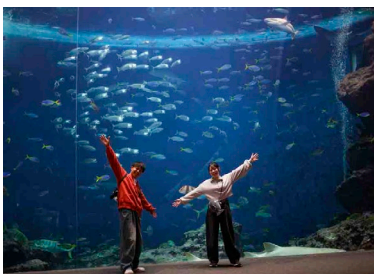
・「無限の海」グループ記念写真

・参加特典など 参加特典として、隣接する駐車場の確保※ 1 や当日の1Dayチケットが含まれており、一日を通して鴨川シーワールドを満喫することも可能です。さらに参加者の皆様には、ペットボトルの持ち運びなど、さまざまなシーンで活躍する新商品「くつつタオル」をプレゼントします。