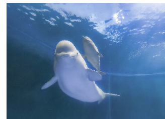
2023年9月に誕生した ベルーガ「テオ」の解説も