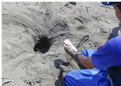
産卵場所の温度計測