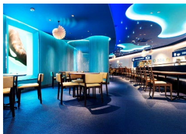
夕食会場のレストラン「OCEAN」