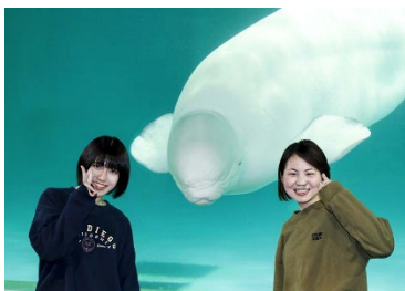
ペルーガと記念写真