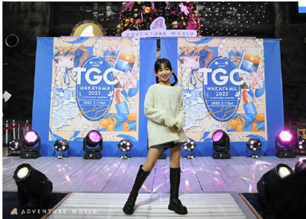
昨年開催 2次審査 公開オーディションの様子